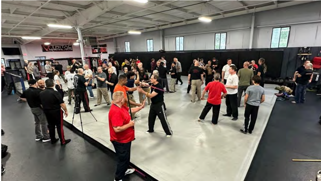
Training auf dem Modern Arnis World Legacy Camp 2023

Am nächsten Morgen ging es dann los. Das lange erwartete Modern Arnis World Legacy Camp 2023 begann um 9:00 Uhr morgens.