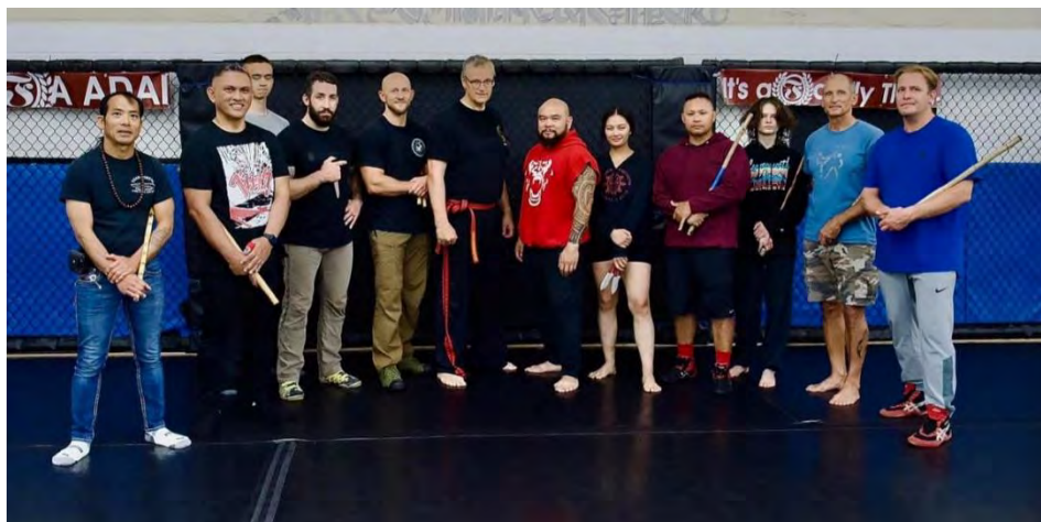
Die Teilnehmer/innen des Lehrgangs in Seattle

Eigentlich sollte Kelly auch unterrichten, aber aus gesundheitlichen Problemen war es ihm leider nicht möglich.