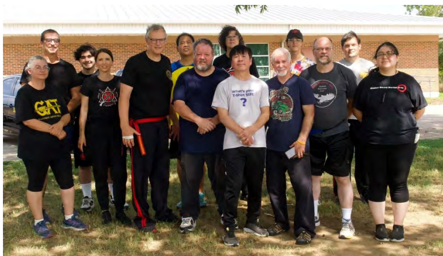
Teilnehmer des Lehrgangs in Roanoke