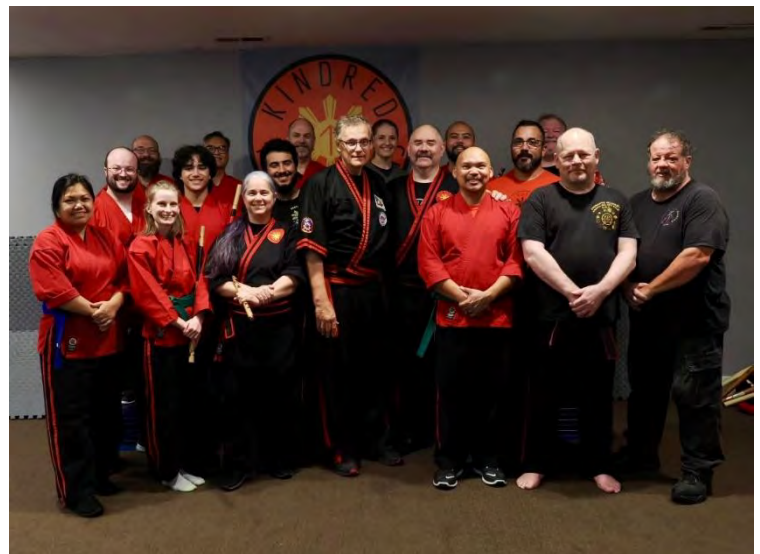
Die Lehrgangsteilnehmer/innen in Kansas City