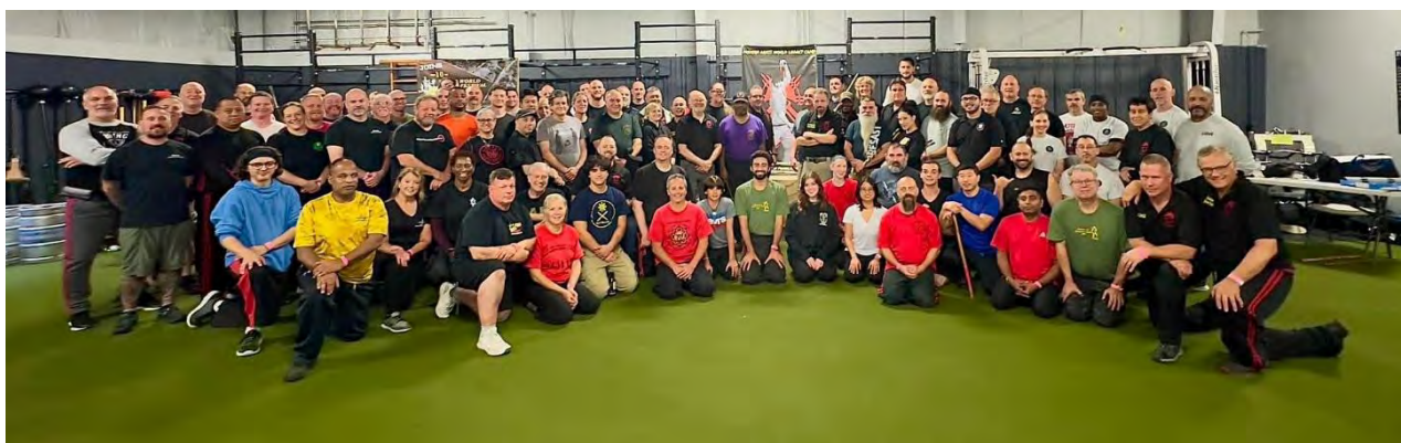
Die Teilnehmerinnen und Teilnehmer des Modern Arnis World Legacy Camp 2023

seinen Gürtel zum 10. Dan Modern Arnis überreichen durfte.