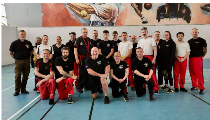
Oben: Die Teilnehmer/innen des Lehrgangs in Brest, Frankreich.

Am Samstag ging der Lehrgang um 9:00 Uhr los und endete um 15:15 Uhr. In der ersten Stunde habe ich im Bereich Einzelstock die 2. Serie mit anschließenden Hebel- und Wurftechniken unterrichtet. In der zweiten Einheit wurde Selbstverteidigung mit dem Impact Kerambit trainiert. In der dritten Stunde unterrichtete ich Selbstverteidigung gegen Messer-Angriffe, auf der Basis vom Reactive Knife.